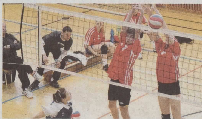
BLOKY Gymnázia Česká a Olympijských nadějí.