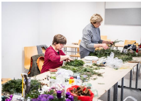
U3V – Vánoční tvoření