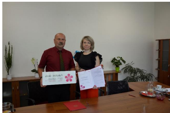
Podpis smlouvy s fakultní střední školou OA T. G. Masaryka Jindřichův Hradec