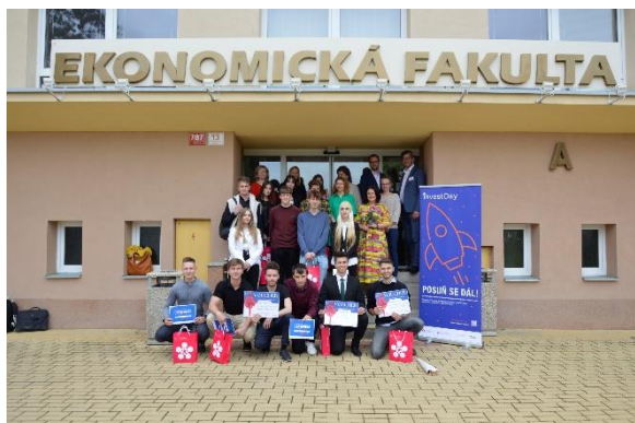
Finále Invest Day 2023