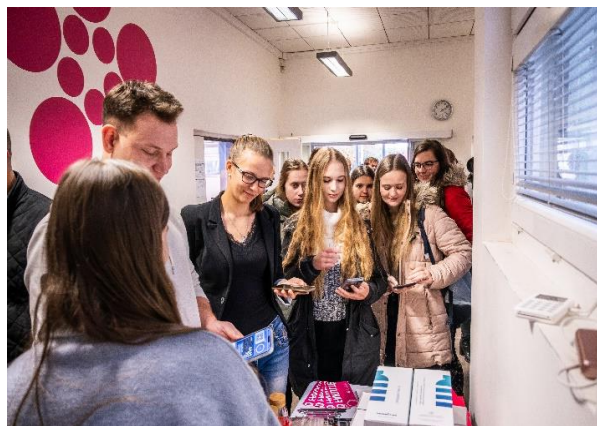
Otevření filtrační stanice LOKNI